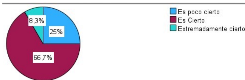
Gráfico 2. Ve los problemas como desafíos

El presente gráfico representa que tan cierto es que los jóvenes en el rango de 15 a 19 años intentan ver sus problemas como desafíos.