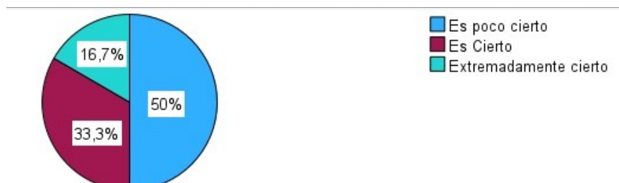
Gráfico 1. Resolución de problemas con la mejor solución