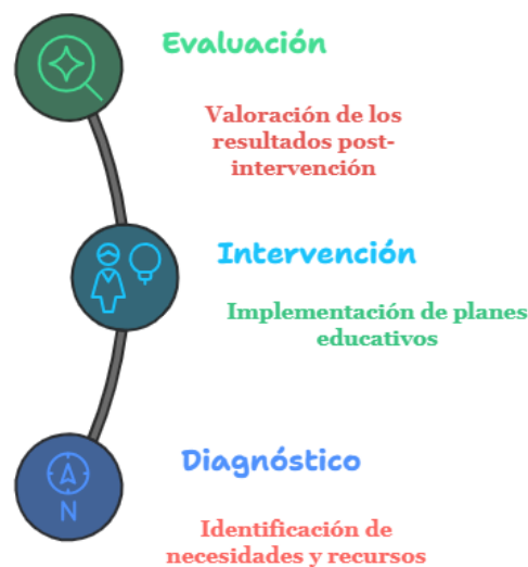
Figura 1. Acciones educativas en la prevención y control de la HPA en la zona urbana del cantón Jipijapa