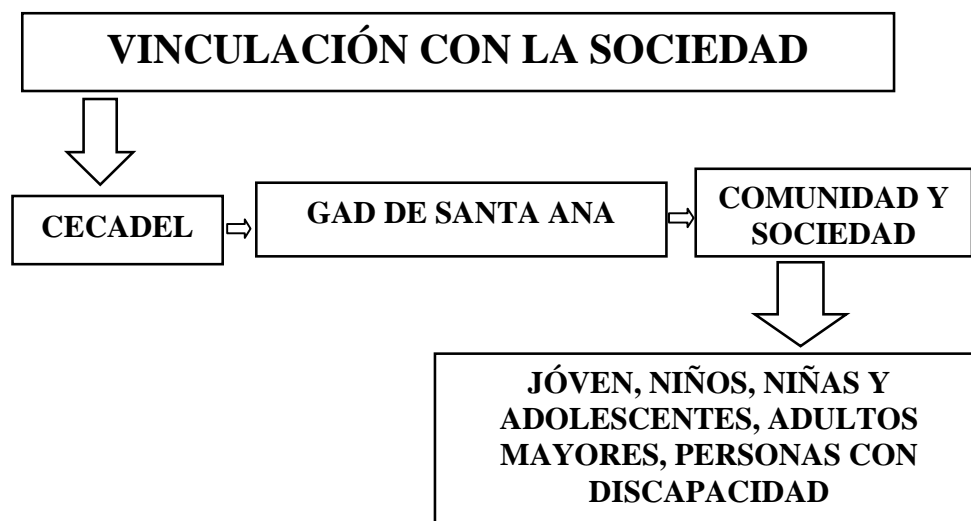
Figura 1: Gráfico que demuestra la vinculación del CECADEL-CIAM con la sociedad. Elaboración de los autores

El Centro de Capacitación y Desarrollo Local (CECADEL) de Santa Ana está muy ligado al Centro de Investigación Agropecuario de Manabí (CIAM), en el objetivo de ambas se encuentra la misión de Vinculación con la sociedad, en cómo trabajar para lograr cambios sustanciales ya sea en el conocimiento de los problemas de la realidad, como en el enfrentamiento de la población en temas de liderazgos visto en la perspectiva de contar con el relevo de la sociedad con mejor conocimiento, no solo de su entorno sino de la provincia y del país y para ello, se trabajó con el siguiente esquema reflejado en la Figura 1: