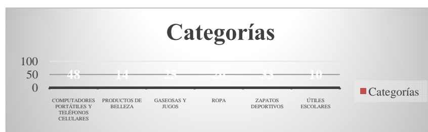
Figura 1: Categoría de los productos más comprados.

De los 150 estudiantes encuestados los productos más comprados o de consumo usual son los computadores portátiles y teléfonos celulares con el 32%, los zapatos deportivos con el 22% y las gaseosas y jugos con el 17%. A partir de estos resultados se puede deducir que como consecuencia del constante avance tecnológico de la mano con la globalización, los estudiantes o en sí la nueva generación se ve obligada a adquirir equipos electrónicos como una necesidad. En este sentido, el marketing debe abordar a los consumidores como individuos de necesidades complejas que esperan mucho más que sólo productos, esperan valores con los que identificarse (Kotler, Kartajaya, & Setiawan, 2010).