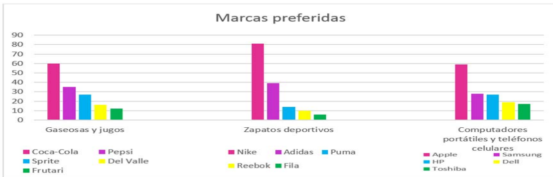
Figura 2: En relación a marcas preferidas a la hora de comprar

En esta sección, tomamos en cuenta las tres categorías con mayor porcentaje a partir de los resultados de los encuestados, logramos identificar las cinco marcas más representativas y que tienen mayor acogida entre los jóvenes estudiantes universitarios, donde Coca-Cola, Nike y Apple lideran el mercado, cada una en su respectiva categoría. El involucramiento con el producto se refiere al nivel de interés que tiene un consumidor por un producto específico. Los mercadólogos inteligentes están despertando ante la idea de que sus fanáticos más ávidos son un gran recurso; en vez de ignorar sus sugerencias, saben que deben tomarlas en serio.